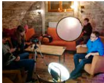
Die Bandbreite der Förderungen ist groß: dazu gehören Theaterprojekte, kreative Projekte, Jugendtreffs...