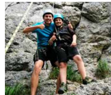
...interkulturelle und integrative Projekte, Präventionsprojekte, Schulprojekte, kirchliche Projekte, Umweltprojekte und Freizeitaktivitäten.