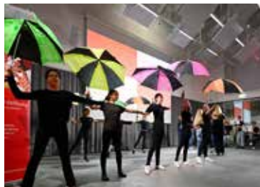
Der Festakt im Herbst spiegelt das vielfältige Engagement und die Begabungen im Landkreis.